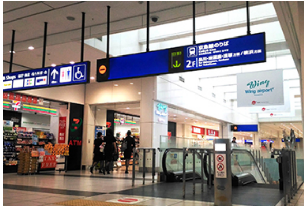
윙 에어포트 하네다