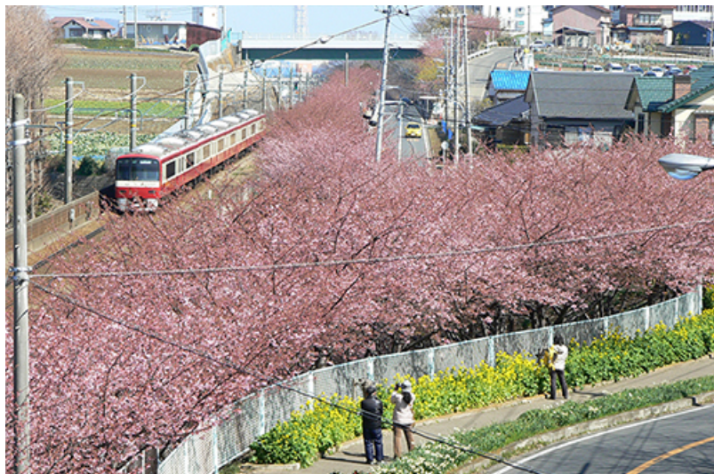
미우라 해안의 가와즈 벚꽃 모습

http://www.haneda-tokyo-access.com/en/info/pdf/catalog_04.pdf ( 영어 )